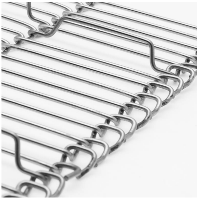
Banda metálica de alambres engarzados con arrastradores (TDA)