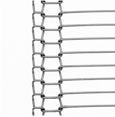
Banda metálica de alambres engarzados con orilla doble (TDA)