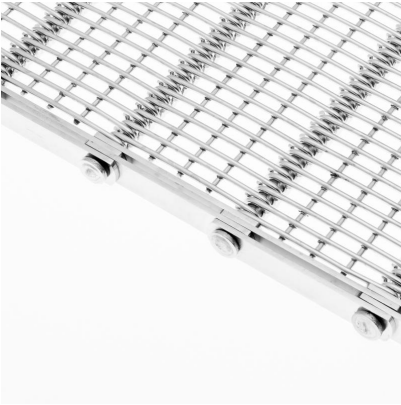
Banda metálica de malla gancho con varilla electrosoldada (CMG-VE)