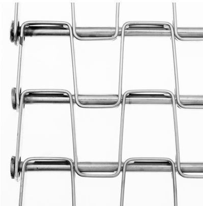
Banda metálica de fleje soldada (TDF)