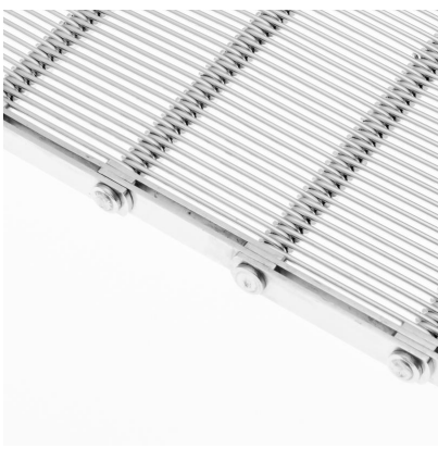
Tapis métallique en toile crochet